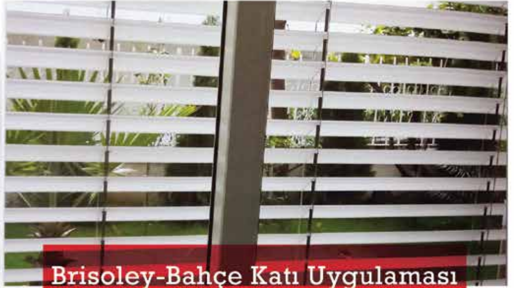
Brisoley-Bahçe Katı Uygulaması