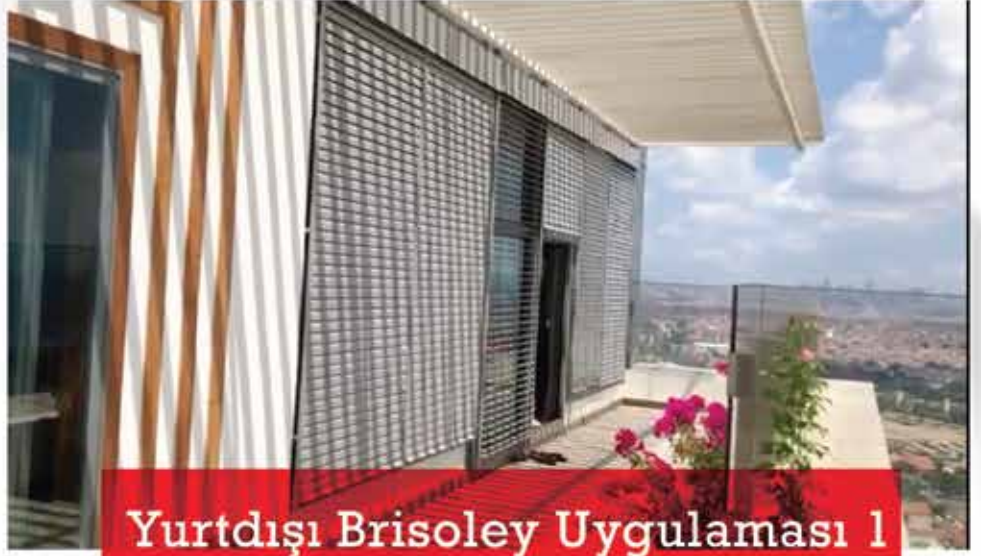
Yurtdışı Brisoley Uygulaması 1