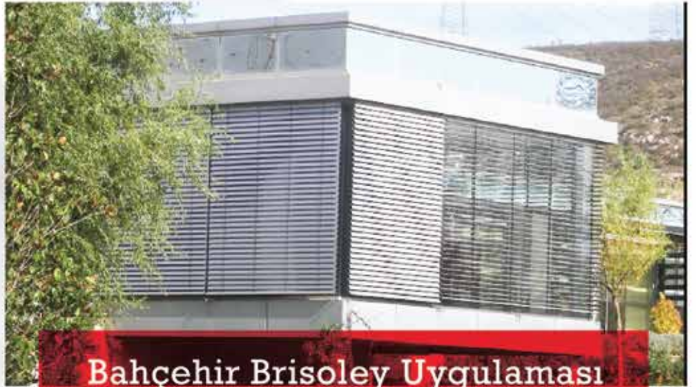
Bahçehir Brisoley Uygulaması