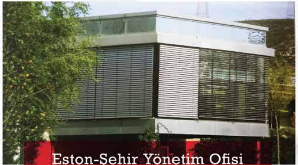
Eston-Şehir Yönetim Ofisi