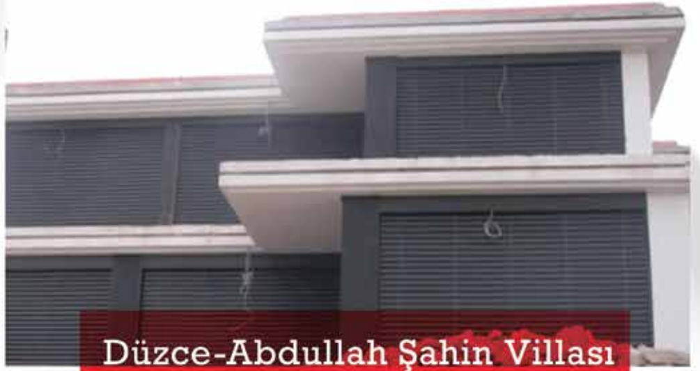
Düzce-Abdullah Şahin Villası