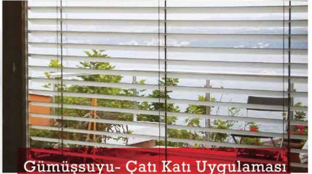
Gümüşsuyu- Çatı Katı Uygulaması