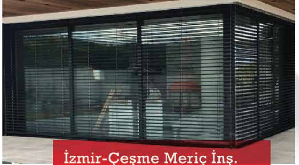
İzmir-Çeşme Meriç İnş.