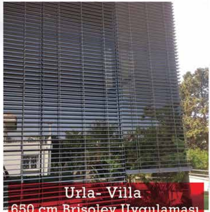
Urla- Villa 650 cm Brisoley Uygulaması