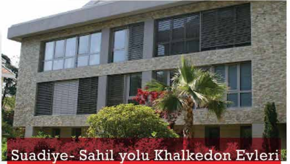
Suadiye- Sahil yolu Khalkedon Evleri