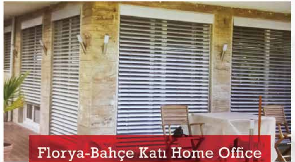
Florya-Bahçe Katı Home Office