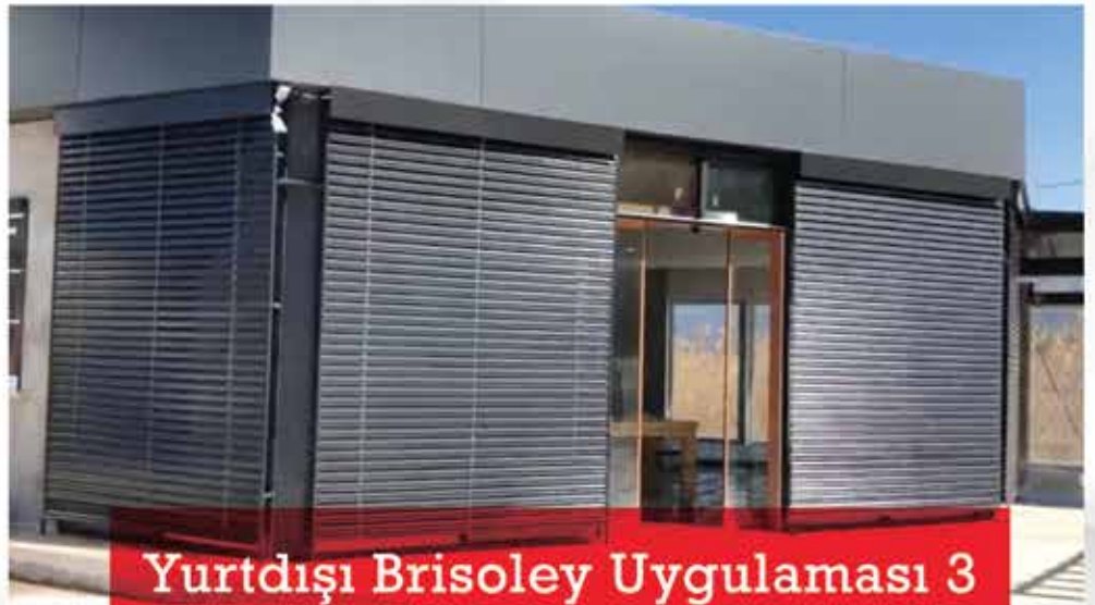
Yurtdışı Brisoley Uygulaması 3