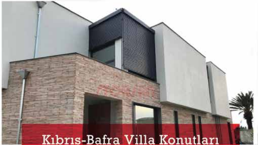
Kıbrıs-Bafra Villa Konutları