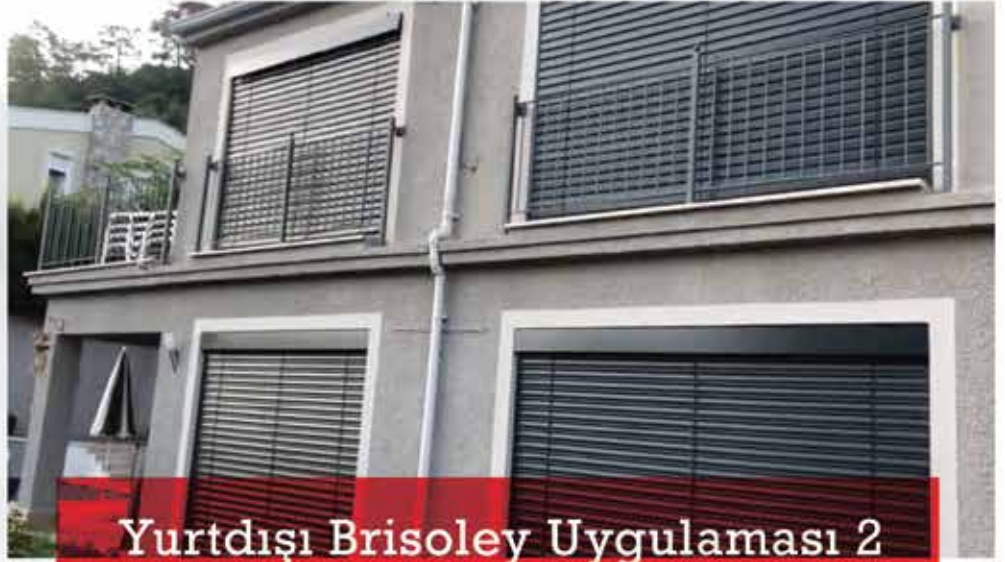
Yurtdışı Brisoley Uygulaması 2