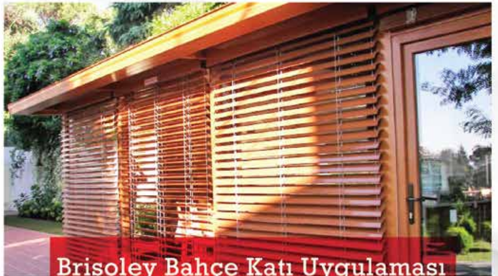
Brisoley Bahçe Katı Uygulaması