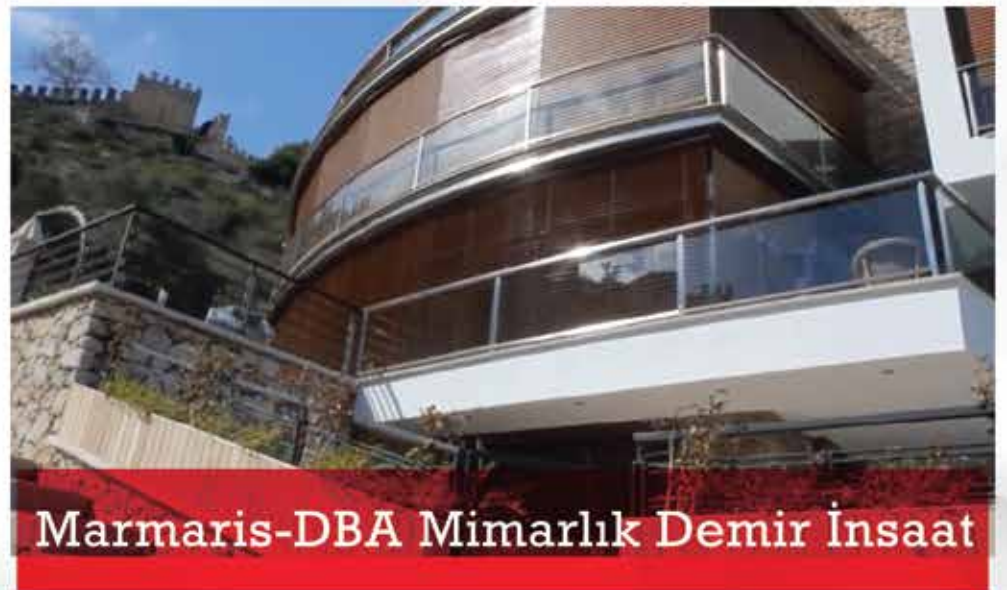
Marmaris-DBA Mimarlık Demir İnfaat