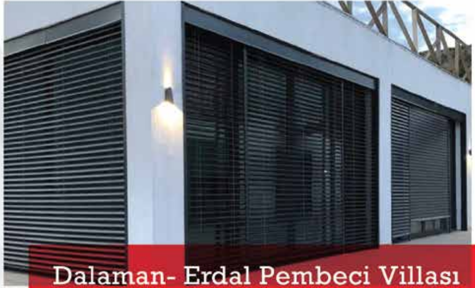
Dalaman- Erdal Pembeci Villası