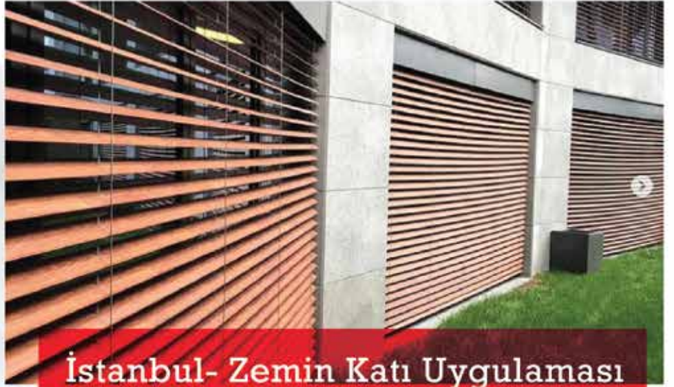
İstanbul- Zemin Katı Uygulaması