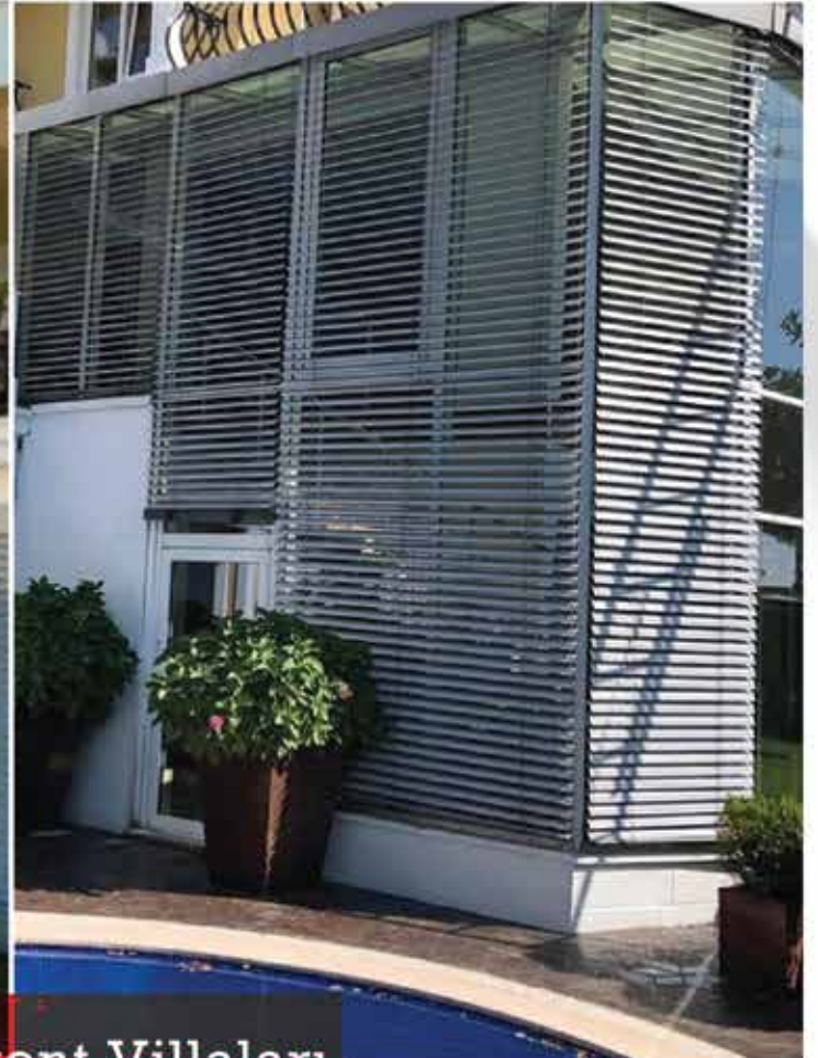
Beykoz- Acarkent Villaları